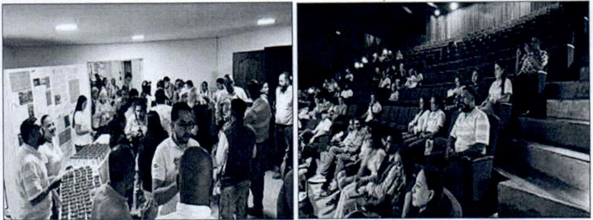
Asistencia y apoyo evento "Cali Ciudad de las Aves) (se anexa listado de asistencia de la actividad de las aves)

Para constancia de lo anterior se firma en Santiago de Cali a los (13) días del mes de noviembre de dos mil veinticuatro (2024).