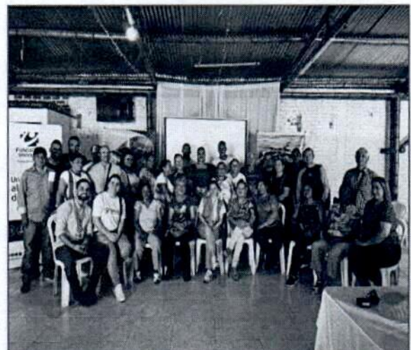
Registro fotográfico" implementación de sistemas ecoeficientes" (se anexa listado de asistencia de la actividad sistemas ecoeficientes)