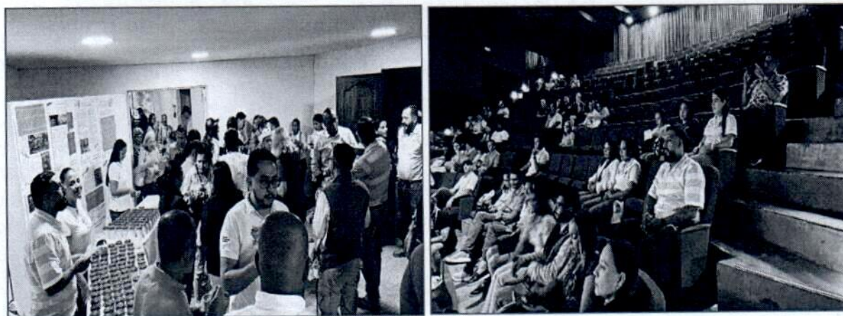
Registro fotográfico "Cali ciudad de las aves" (se anexa listado de asistencia de la actividad de las aves)