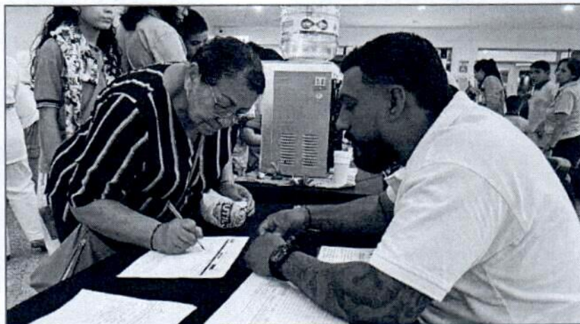
Registro fotográfico "Valle un Aula Verde" (se anexa listado de asistencia de la actividad Valle un Aula Verde)