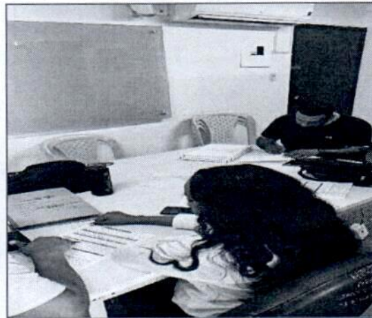
Registro fotográfico de las actividades de noviembre: foliar, tramitar, organizar, archivar y radicar los documentos