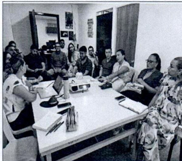
Registro fotográfico conformación de equipo y socialización estrategia COPITO recicla y participa

(Se anexa listado de asistencia socialización COPITO RECICLA)